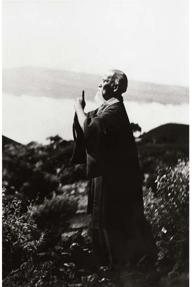
Morihei Ueshiba (fondateur de l'aikido)

L'Archange Michael : «Si tu parviens un jour à transmettre à quel point tu disposes de ce savoir que tu possèdes pour Dieu 'par souvenir', et que tu es et que tu fus un témoin céleste ou humain de presque toutes les époques, et de la loi, parce que tu te souviens d'avoir été présent lorsqu'elle fut créée, alors un grand bout du chemin sera parcouru. Ou bien tu cesses tout, et tu ne t'occupes enfin que de toi, ce qui serait très bénéfique. Je vois ton interrogation à l'instant, ça te parle non? Je te rappelle que tu ne disposes de presque aucun soutien, et que si tu le veux ce peu de soutien